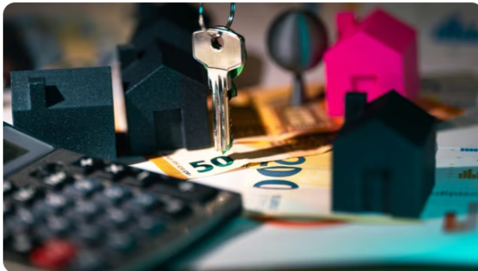
Taxe foncière : dans quelles villes a-t-elle le plus flambé ces dernières années ?

Impôt obligatoire chaque année pour tous les propriétaires, la taxe foncière est en hausse partout en France. Pire, la note s'envole dans certaines grandes villes du pays. Selon un classement effectué sur les 30 plus grandes villes françaises par le comparateur ORKA.tax, la taxe foncière a ainsi doublé à certains endroits au grand dam des propriétaires.