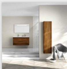
Meuble de salle de