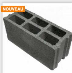
Bloc béton standard